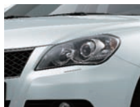
Snow White Pearl Metallic (ZMT)