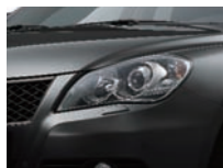
Super Black Pearl Metallic (ZMV)