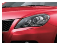
Fervent Red (ZNB)