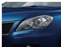
Prussian Blue Pearl Metallic (ZMZ) seulement 4x4