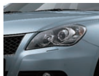
Glacier Blue Metallic (ZPM) seulement 4x4