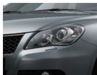
Mineral Gray Metallic (ZMW)