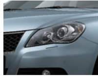
Glacier Blue Metallic (ZPM) solo 4x4