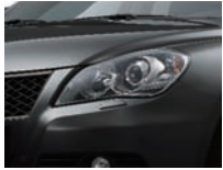
Super Black Pearl Metallic (ZMV)