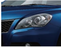
Prussian Blue Pearl Metallic (ZMZ) solo 4x4