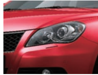
Fervent Red (ZNB)