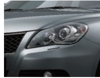
Mineral Gray Metallic (ZMW)