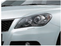
Snow White Pearl Metallic (ZMT)