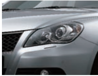
Premium Silver Metallic (ZNC)